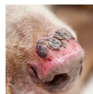
QUEMADURAS, EROSIONES O ÚLCERAS