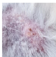
DERMATITIS ATÓPICA Y ALÉRGICA