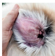
INFECCIONES POR MALASSEZIA