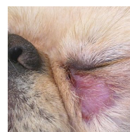
PIODERMA SUPERFICIAL Y DE SUPERFICIE