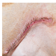
REDUCCIÓN DE CICATRICES