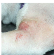
ERITEMA DE SIMPLE A SEVERO