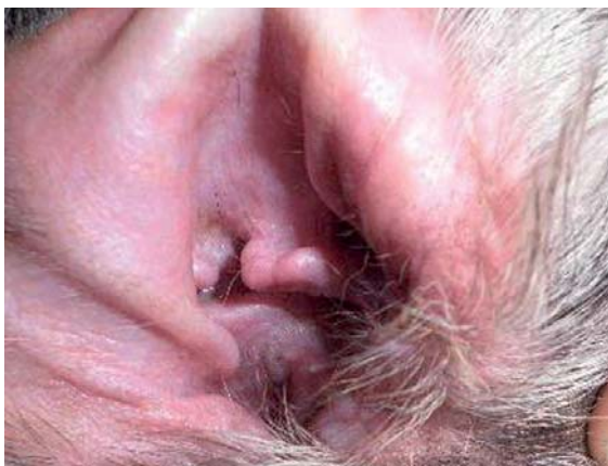
Figura 4: El conducto al mes de tratamiento.

Entre las etiologías primarias más frecuentes se encuentran las alergias: DAC, DAA, y otras como la dermatitis irritativa de contacto.