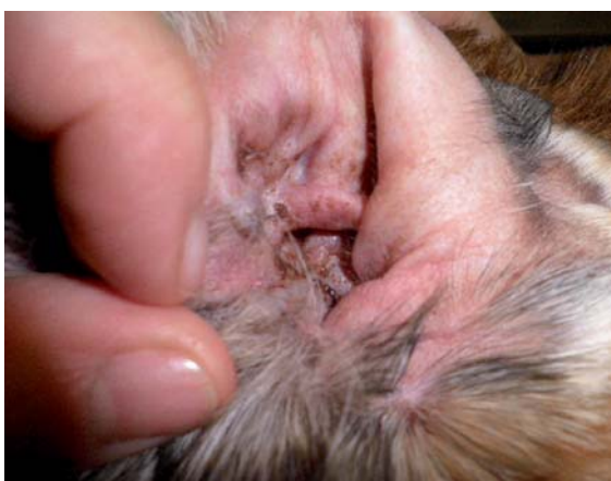
Figura 3: Aspecto del conducto a los 15 días de tratamiento, antes de iniciar tratamiento tópico.

La otitis externa del perro es una de las patologías más frecuentes en la clínica de pequeños animales. Tiene un origen multifactorial en cuya etiopatogenia intervienen causas primarias (desencadenantes), factores predisponentes y factores perpetuantes que favorecen su cronicidad.