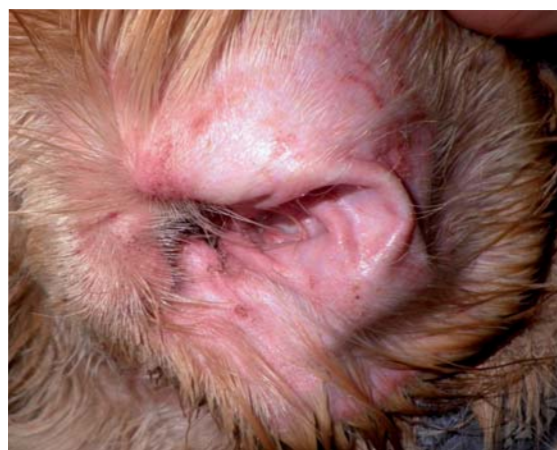
Figuras 1 y 2: Cara interna de ambos pabellones auriculares (derecho e izquierdo) tras el lavado, antes de iniciar tratamiento con Apoquel®. Se aprecia el proceso inflamatorio intenso (imagen superior) y las excoriaciones secundarias al rascado (imagen inferior).